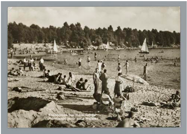
Strandleben am Knappensee, ca. 1972

Im montan.dok existiert zwar keine spezielle Sammlung historischer Post- bzw. Ansichtskarten, und auch bei der Erschließung sind sie in früheren Zeiten nicht systematisch ausgewiesen worden. Gleichwohl finden sie sich zahlreich in den Sammlungen und Beständen der Fotothek und des Bergbau-Archivs Bochum. Bestandsergänzend konnte jüngst für die Sonderausstellung „Gras drüber ... Bergbau und Umwelt im deutsch-deutschen Vergleich“ ein Konvolut von 14 Ansichtskarten aus den Jahren von ca. 1965 bis 1982 für die Fotothek erworben werden. Sie zeigen das scheinbar unbeschwerte Urlaubs- und Freizeitvergnügen am Knappensee im Kreis Hoyerswerda in der DDR.