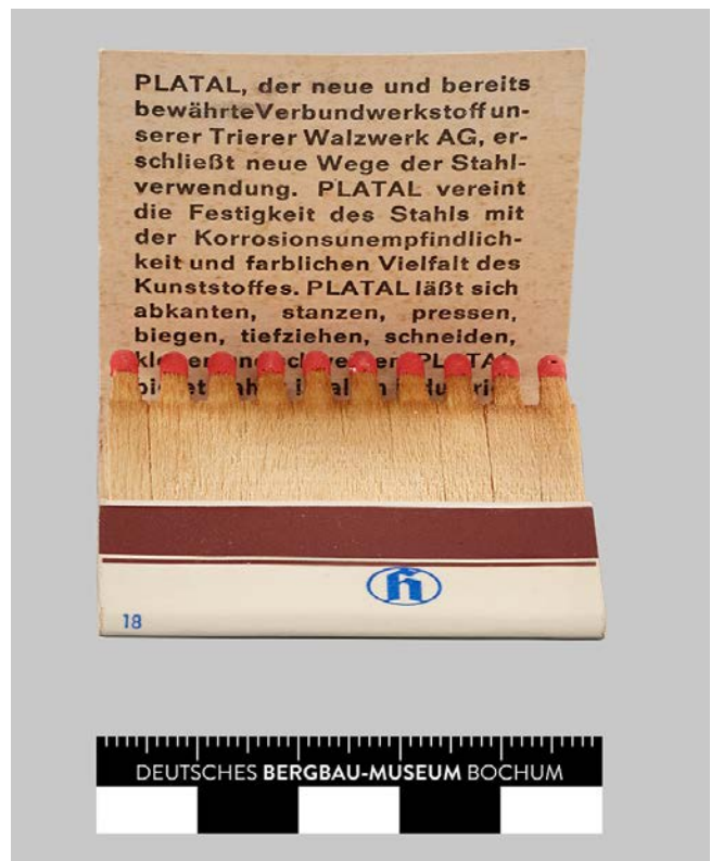
Streichholzbriefchen mit Werbung für Platal (Privatbesitz Silke Haps)

als Themenheft in der renommierten Zeitschrift „architectura. Zeitschrift für Geschichte der Baukunst“ erscheinen. Hieran anknüpfend wird im August 2022 das 2. Werkstattgespräch stattfinden, das sich dem Thema „Wissensnetzwerke“ widmet. Basierend auf eigenen Forschungen sollen für das Segment des Fertighausbaus Netzwerke inner- und außerhalb von Firmen erkundet werden. Dieser Vergleich erlaubt, Spezifika der Wissensnetzwerke von Krupp und Hoesch präziser zu bestimmen. Diskutiert werden soll anhand dieser Fallbeispiele darüber hinaus, welche denkmalpflegerische Bedeutung sich aus ihnen ableiten lässt. Für das laufende Jahr ist geplant, die Struktur der Projektmonographie festzulegen und erste Texte für diese abzufassen. Darüber hinaus steht gegen Ende des Jahres die Arbeit an einem Fortsetzungsantrag an, beginnt doch die zweite Phase des SPP 2255 zum 01. Januar 2024.