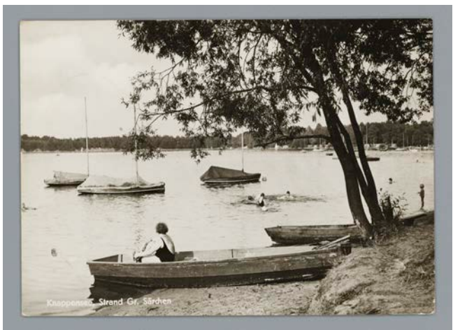
Urlaubsidyll am Knappensee, ca. 1977

Der See entstand seit 1945 durch Flutung des ehemaligen Tagebaus Werminghoff und wurde dann zur Wassersport- und Erholungslandschaft umgestaltet. Solch eine Nachnutzung ehemaliger Bergbauanlagen und -flächen als Naherholungsgebiete fand durchaus Zuspruch vorrangig bei der ansässigen Bevölkerung. Am Knappensee zählte man bereits 1954 an Sonntagen bis zu 3000 Besucher, 1959 waren es bis zu 8000, und in den 1960er-Jahren erfreute sich der See bei Badegästen, Wassersportlern und Dauercampfern großer Beliebtheit. Die in Sichtweite immer auch präsenten Anlagen der Braunkohlenindustrie werden auf den Ansichtskarten allerdings nicht gezeigt, und die schönen Bilder auf den Ansichtskarten dürfen keineswegs über die vielfachen Beeinträchtigungen der Umwelt durch den Bergbau im Lausitzer Braunkohlenbergbau und in den anderen deutschen Bergbaurevieren hinwegtäuschen.