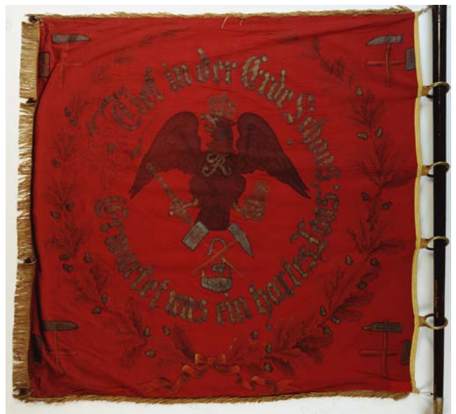
Bergbaufahne des Knappenvereins „Schlägel und Eisen“ Bochum-Linden-Dahlhausen von 1921, Rückseite (montan.dok 037000814001)

So heben sich die Schriftzüge „Knappen-Unterstützungs-Verein“, „Schlägel u[nd] Eisen“ und „Linden-Dahlhausen 1921“ vor einem hellen Hintergrund gegenüber dem Rest der Fahne ab. Es zeigt sich, dass diese Teile in eine alte Fahne neu eingnäht wurden und den vorherigen Schriftzug ersetzen. Denn nur ein Jahr nach seiner Gründung hatte der Linden-Dahlhausener Verein das Inventar und die Mitglieder des kurz zuvor aufgelösten Knappenvereins „Glückauf!“ Hattingen übernommen, darunter auch dessen Fahne. Anstelle einer kostspieligen Neuanschaffung entschloss man sich dazu, die alte Fahne kurzerhand umzuarbeiten. So schnitt man die Schriftzüge „Knappen-Verein ‚Glückauf!‘ Hattingen“ und „Hattingen 1884“ heraus und ersetzte sie durch zwei neue. Auch eine hier vorher vorhandene Krone wurde nun oberhalb des Wappens durch die strahlende Sonne ersetzt. Die verbliebenen Fahnenabschnitte waren noch bis vor wenigen Jahren im Verein vorhanden und wurden dort fotografiert. Seitdem hat sich ihre Spur leider verloren.