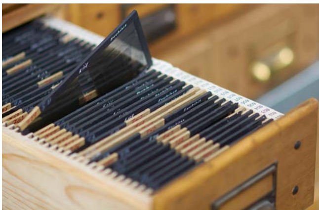
Ursprüngliche Magazinierung der Stereofotografien

Mit der retrospektiven Digitalisierung der „Fotosammlung Stereofotografien“ des DBM konnte Wissenschaft und Öffentlichkeit ein historisch relevanter und in der Vergangenheit bereits des Öfteren angefragter Quellenfundus endlich online verfügbar gemacht werden. Im Rahmen des Projekts wurde zudem eine systematische Prüfung und Anreicherung der vorhandenen Erschließungsdaten durchgeführt und damit deren Qualität optimiert. Über die Online-Stellung der eigentlichen Fotosammlung hinaus konnte damit die digitale Verfügbarkeit und Sichtbarkeit des im montan.dok bewahrten kulturellen Erbes insgesamt nachhaltig verbessert werden.