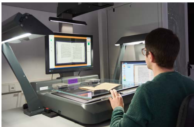
Digitalisierungsarbeiten im montan.dok

Dabei kann im montan.dok bereits auf die an verschiedenen Stellen formulierten und auch publizierten strategischen Überlegungen sowie auf das Wissen, die Erfahrungen und die Strukturen zurückgegriffen werden, die bislang nicht zuletzt in mehreren Digitalisierungs- und Infrastrukturprojekten aufgebaut worden sind. Die jetzt abgeschlossene Digitalisierung und Online-Stellung ei-