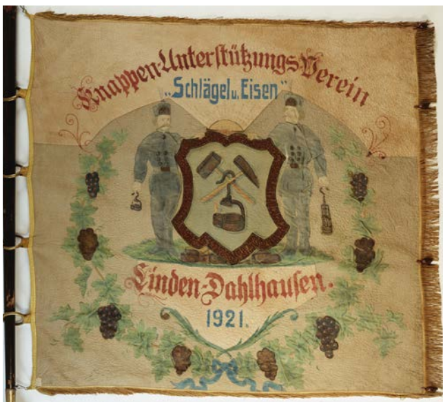
Bergbaufahne des Knappenvereins „Schlägel und Eisen“ Bochum-Linden-Dahlhausen von 1921, Vorderseite

Umso erfreulicher ist es, dass die umfangreiche Sammlung von Bergbaufahnen in den Musealen Sammlungen des montan.dok um ein weiteres Stück vermehrt werden konnte. Es handelt sich dabei um die erste Bergbaufahne des 1921 gegründeten Knappenvereins „Schlägel und Eisen“ Bochum-Linden-Dahlhausen, in dem sich Bergleute der damals zahlreichen Zechen des Bochumer Südens zusammenfanden.