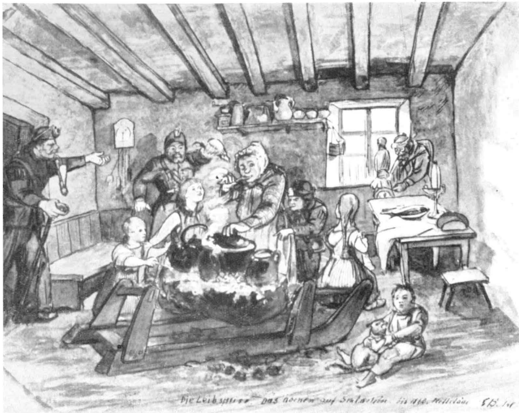
In einem Bergmannshause: Die Leibspeise. Das Kochen auf Schlacken bis 1860 in Hetstedt. Der Schlitten auf dem man die Schlacken heimführte (vgl. Titelbild), wurde in die Stube geschoben und er- setzte hier den Herd. Im Hintergrund die Groß- mutter am Spinnrocken. Der größte Junge muß schon als „Huntejunge“ mit in den Schacht. Aqua- rell (1906) von Gustav Ballin.