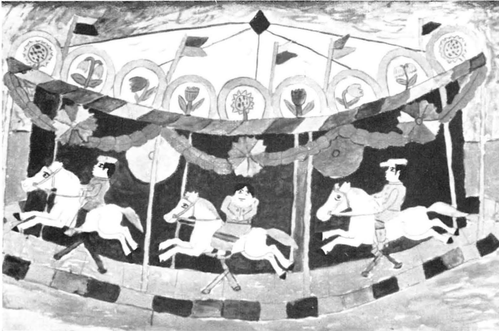
Nebenstehend: Carl Thegen: Karussell