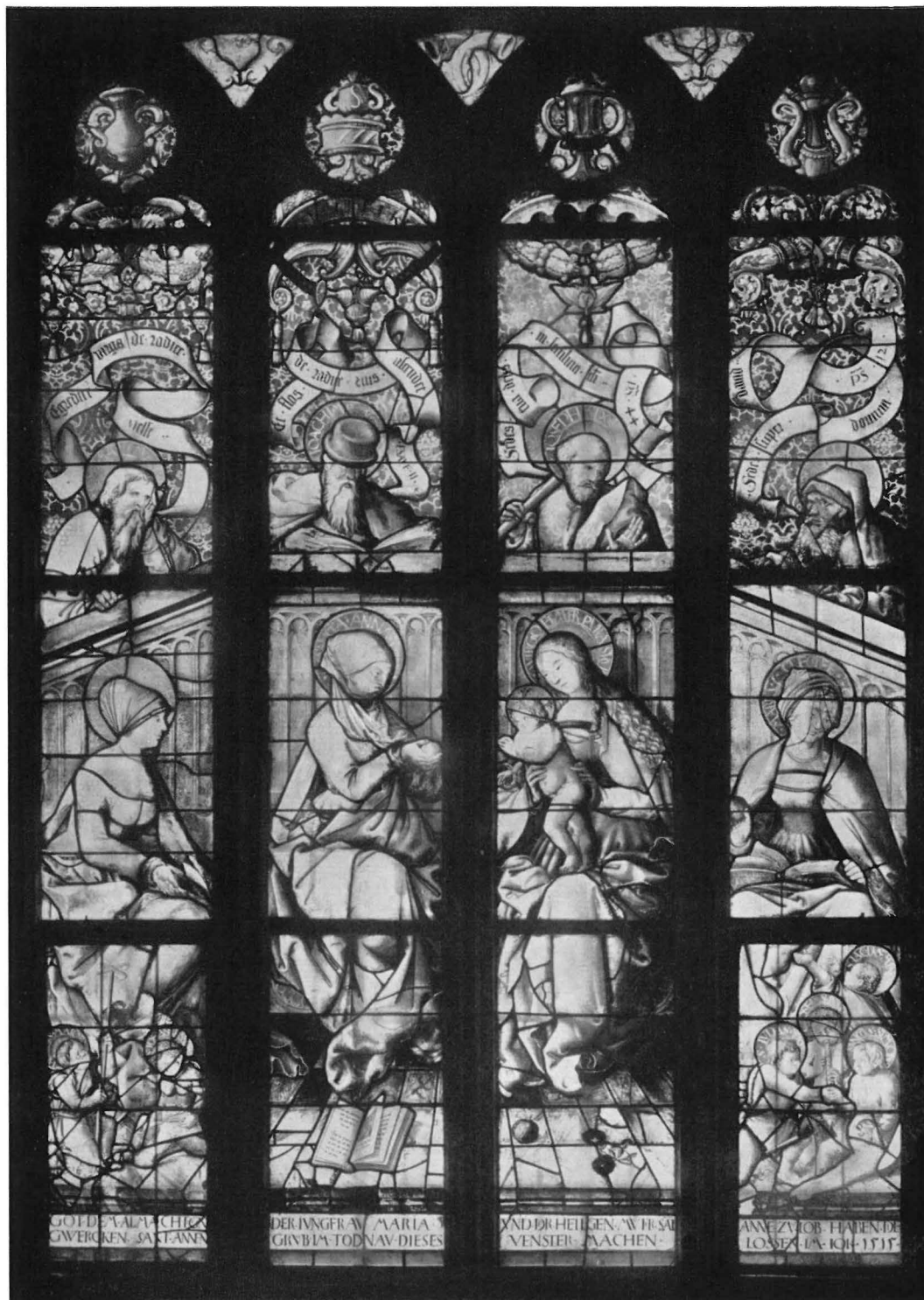
Abb. 10: Das Fenster der Alexander-Kapelle, Entwurf: Hans Bal- dung Grien.