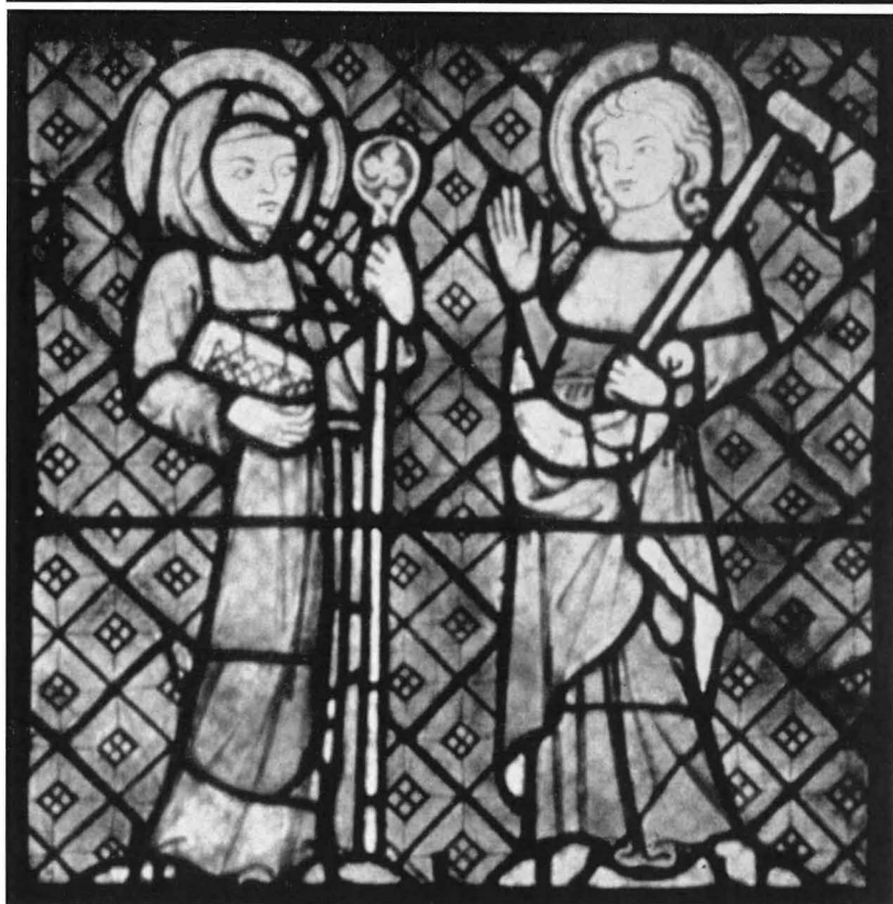
Abb. 4: Der hl. Jakobus mit Pilgerstab und Muschel (Detail aus Abbildung 1).