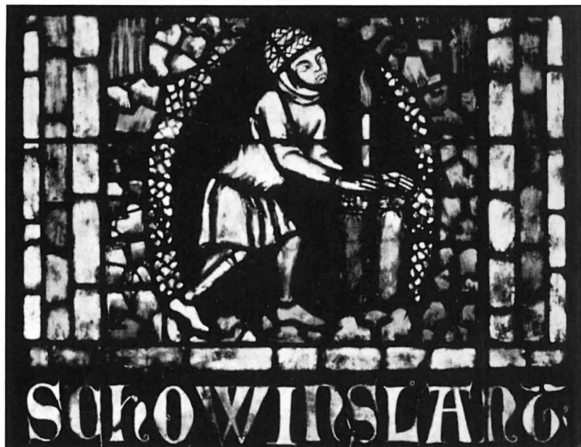
Abb. 7 bis 9: Details aus dem Schauinsland-Fenster.