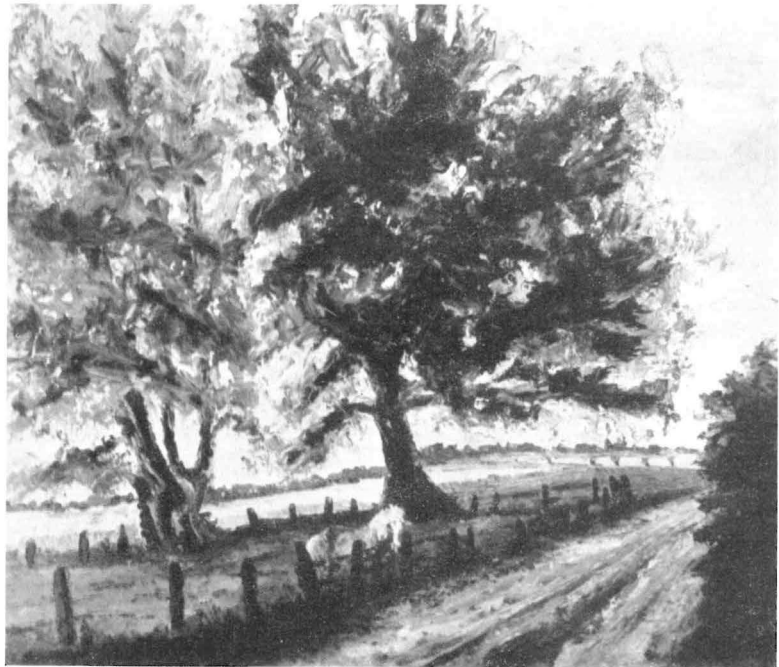
Walter Zimmer (Zeche Königsborn), „Pferdekoppel“, Öl

Auffallend ist, daß sich nur ein kleiner Teil der Bilder mit der Welt der Arbeit auseinandersetzt. Es mag dies darin seinen Grund haben, daß der Kursusleiter die Teilnehmer während der schönen Jahreszeit möglichst in die freie Natur führte, was sehr zu begrüßen ist. S.