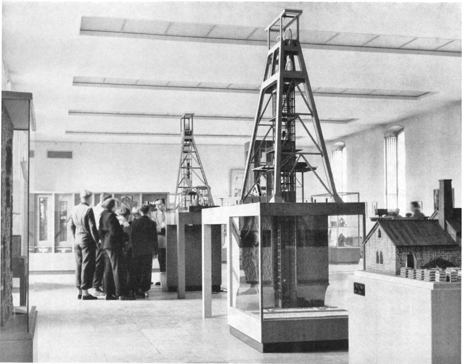
Die über drei Meter hohen Schachtgerüst-Modelle in der Abteilung „Förderung“ üben auf die jungen Bergleute immer wieder eine besondere Anziehungskraft aus.