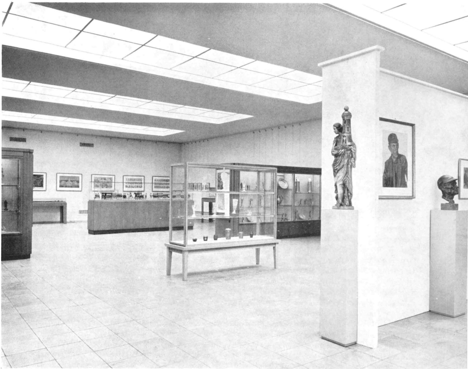
In den Vitrinen des Oberlichtsaales zeugen Kunstgegenstände aus allen Zeiten und Landschaften von der kulturschaffenden Kraft bergmännischen Brauchtums.

arbeiten. Viele künstlerisch befähigte Bergleute sehen in ihm einen Förderer, der von ganzem Herzen ihre Bemühungen unterstützt.