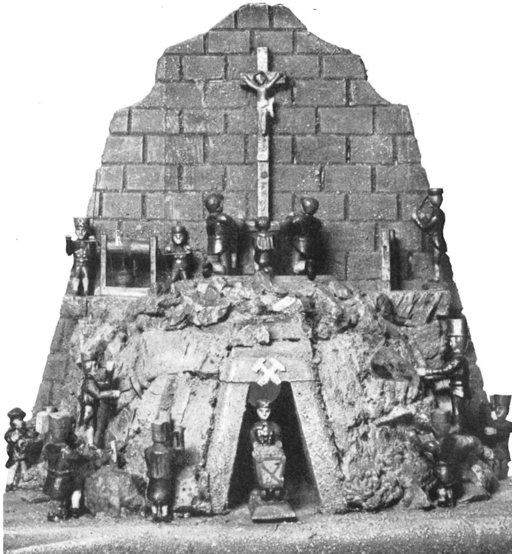
Hausaltar aus St. Joachimsthal.

10 Sarepta pag. 3 a. 11 " " 5 a. 12 " " 170 a. 13 " " 169 a. 14 " " 180 a. 15 " " 191 a. 16 " " 191 b.