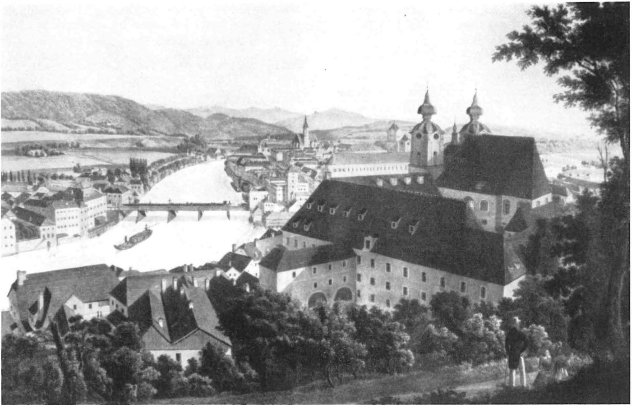
Blick auf Steyr mit der Enns Lithographie des 19. Jahrhunderts

das Verlagswesen; sie und die Stadt Steyr selbst trugen den Gewinn, aber auch das Risiko aus dem weltweiten Handel der süddeutschen Messermetropole. Der Bergmann war nur ein Glied in dieser Kette, wenn auch das erste. Alle aber lebten von der „weltberühmten gotsgab am ertzberg“.