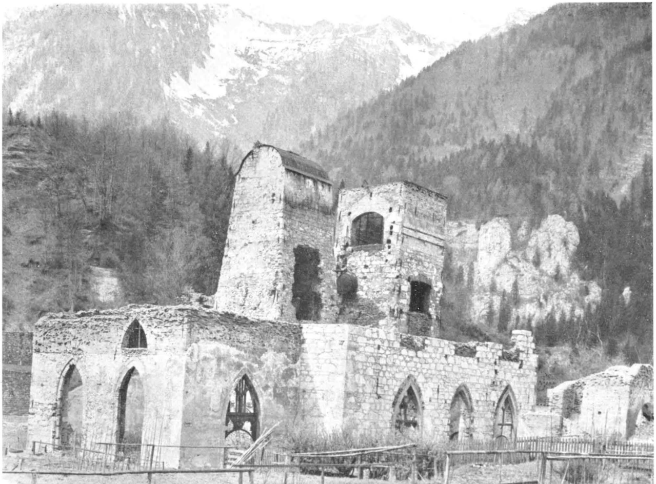
Alter Hochofen im Ennstal

dustrieevölkerung in den Hämmerern und Knappensiedlungen verproviantieren zu können.