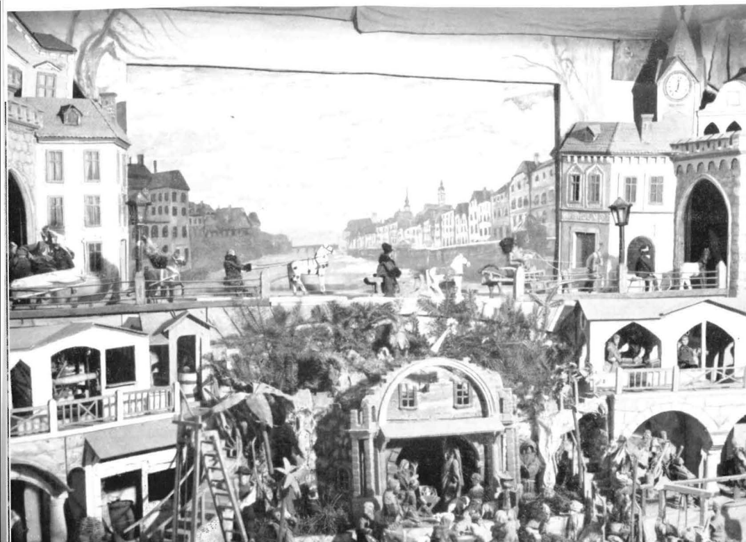
Teilansicht des Steyrer Kripperls

Nach alledem darf es nicht als Übertreibung angesehen werden, wenn man das Steyrer Kripperl als eine einmalige, volkskundliche Fundgrube ersten Ranges bezeichnet, das wohl verdient, mitsamt der alten Eisenstadt über die Grenzen hinaus bekannt zu werden.