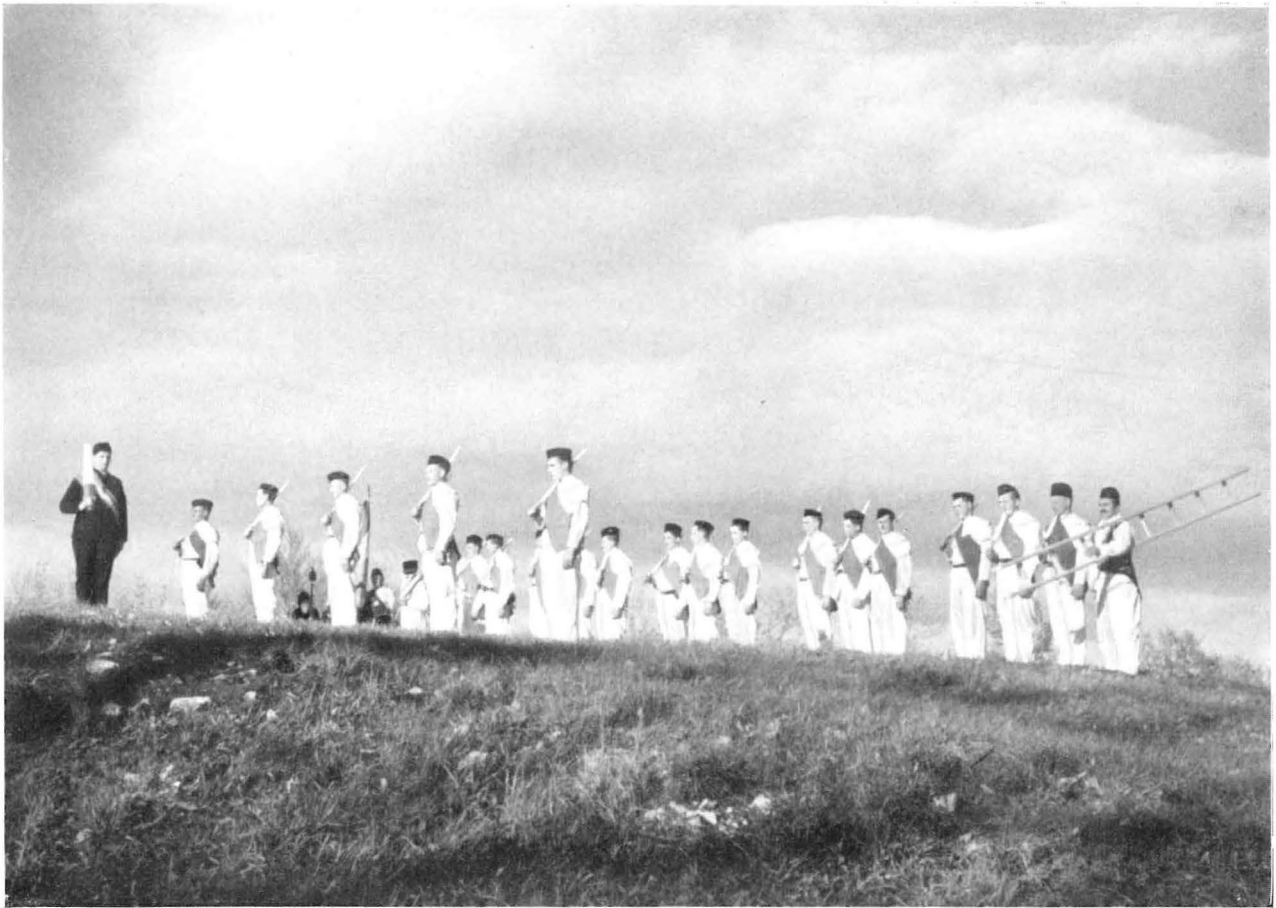
Das „Aufrufen“ zu Beginn des Tanzes

An einigen Stellen setzt die Musik auch ganz aus. Nur das langsame Schreiten über die Schwerter wird von einzelnen Trommelschlägen markiert, ein Schlag auf jeden Schritt. Die Stimmung dabei ist ganz eigen. Alles ist lautlos gespannt, und nur die dumpfen Schläge klingen durch die Stille.