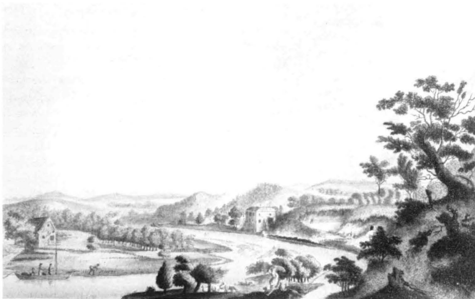
„Aussicht von einer Höhe bey Herbede an der Ruhr nach dem Hause Hardenstein und der Herrlichkeit Witten“. Rechts sind deutlich zwei Stollenmundlöcher und am Ufer gelagerte Kohlen zu erkennen. Nach einer Zeichnung von I. C. Huber.

Wie die Prüfung ausgefallen ist und ob Dortmund weiterhin Märker Holz oder Märker Steinkohle gebrannt hat, ist nicht bekannt. Sicher sind aber die Anregungen v. Hagens nicht wirkungslos geblieben, wie die seit jener Zeit zwar langsam, aber stetig einsetzende Steigerung des Kohlenverbrauchs beweist.