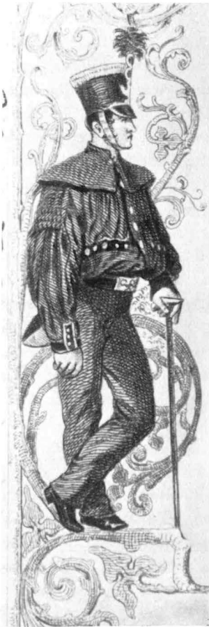
Bergmann in Parädetracht um 1850. Nach einem Stahlstich von W. Riefstahl

Von Museumsdirektor Dr.-Ing. Winkelmann, Bochum