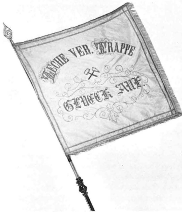
Eine der ältesten Werksfahnen des Ruhrgebiets aus dem Jahre 1840