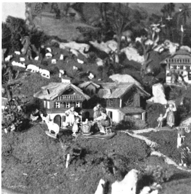
Teilansicht der Grasberger-Krippe mit Mutter an der Wiege

So wird die Krippe eine umfassende Darstellung des heimatischen Lebens, in das der Schnitzer all seine Liebe und Sehnsucht und oft auch ein Stück eigenen Erlebens legt, wenn er — wie dies z. B. in einer Ischler Krippe zu sehen ist — in Erinnerung an die schweren Jahre seiner Kriegsgefangenschaft mitten in die heimische Landschaft eine russische Troika setzt, oder, weil ihm jahrüber Zwillinge geboren wurden, seinem „Vada, la mi a mitgehn!“ statt des üblichen einen gleich zwei Kinder an die Hand gibt. Dadurch wird aber manche Krippe auch zu einer Art Familienchronik.