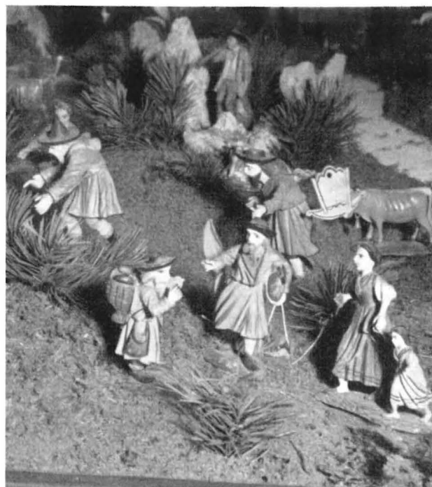
Teilansicht der Daxner-Krippe mit den Figurengruppen „die Nachbarn“, „der Heidlträger“ mit der Wiege auf dem Rücken, „Muatta, la mi a mitgehn!“ und „Lampfänger“.