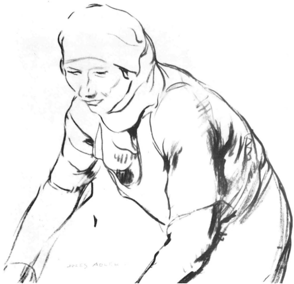
„Schlepperin“ Kohlezeichnung von Jules Adler