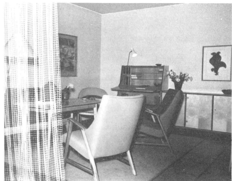
In 30 Ausstellungen gab die Vereinigung vielseitige Anregungen auf dem Gebiet bergmännischer Wohnkultur. Ein besonderer Erfolg war die 1955 im Bergbau-Museum gezeigte Mustermöblierung in Verbindung mit einer für die gesamte Bundesrepublik neuartigen Wohnberatung, aus der unser Bild einen Ausschnitt wiedergibt.

Die in Südfrankreich angestellten Ermittlungen im Gebiet des Mont Ventoux erbrachten ebenfalls Spuren neolithischen Bergbaus. Zahlreiche Oberflächenfunde wurden gesammelt, die uns die Franzosen als Geschenk für das Bergbau-Museum überließen. Es handelt sich in erster Linie um quarzitisches Rillenschlägel. Untertagebau scheint hier, soweit aus äußeren Anzeichen zu entnehmen ist, nicht vorhanden gewesen zu sein. Gefunden wurden lediglich große trichterförmige Tagebaue. Natürlich besteht die Möglichkeit, daß von der Sohle dieser Tagebaue aus in der abgebauten Feuersteinschicht Grubenbaue angelegt wurden.