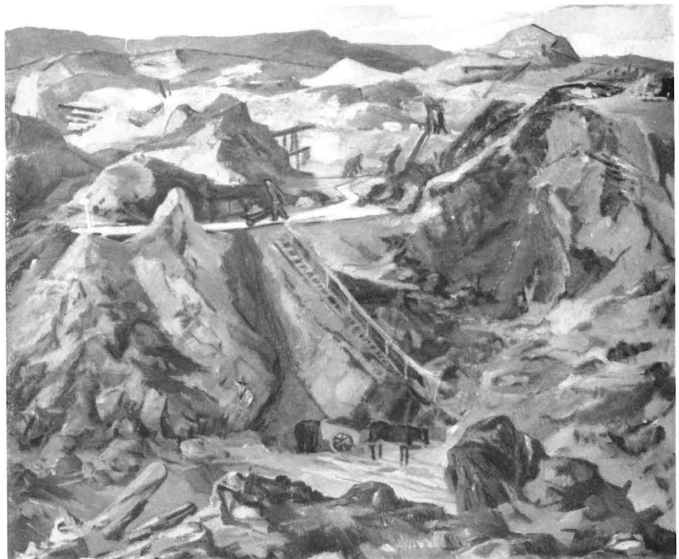
Der zeitgenössische schwedische Maler Helge Zandén war mit seinem Ölgemälde „Grube von Falun“ ebenfalls in Paris vertreten.

Die schwedische Beteiligung an der Pariser Ausstellung wurde von den Werken zweier neuzeitlicher Künstler abgerundet. Der eine, Gustav Alexanderson, hat als Schilderer industrieller Motive Berühmtheit erlangt; nicht zuletzt wegen seiner Bilder aus dem mittelschwedischen Industriebezirk „Bergslagen“, zu dem auch die Kupfergrube in Falun gehört. Der andere, Helge Zandén, nimmt eine hervorragende Stellung unter den zahlreichen Künstlern ein, die sich in Dalarna niedergelassen haben und vorzugsweise Motive aus dieser naturschönen Provinz wählen.