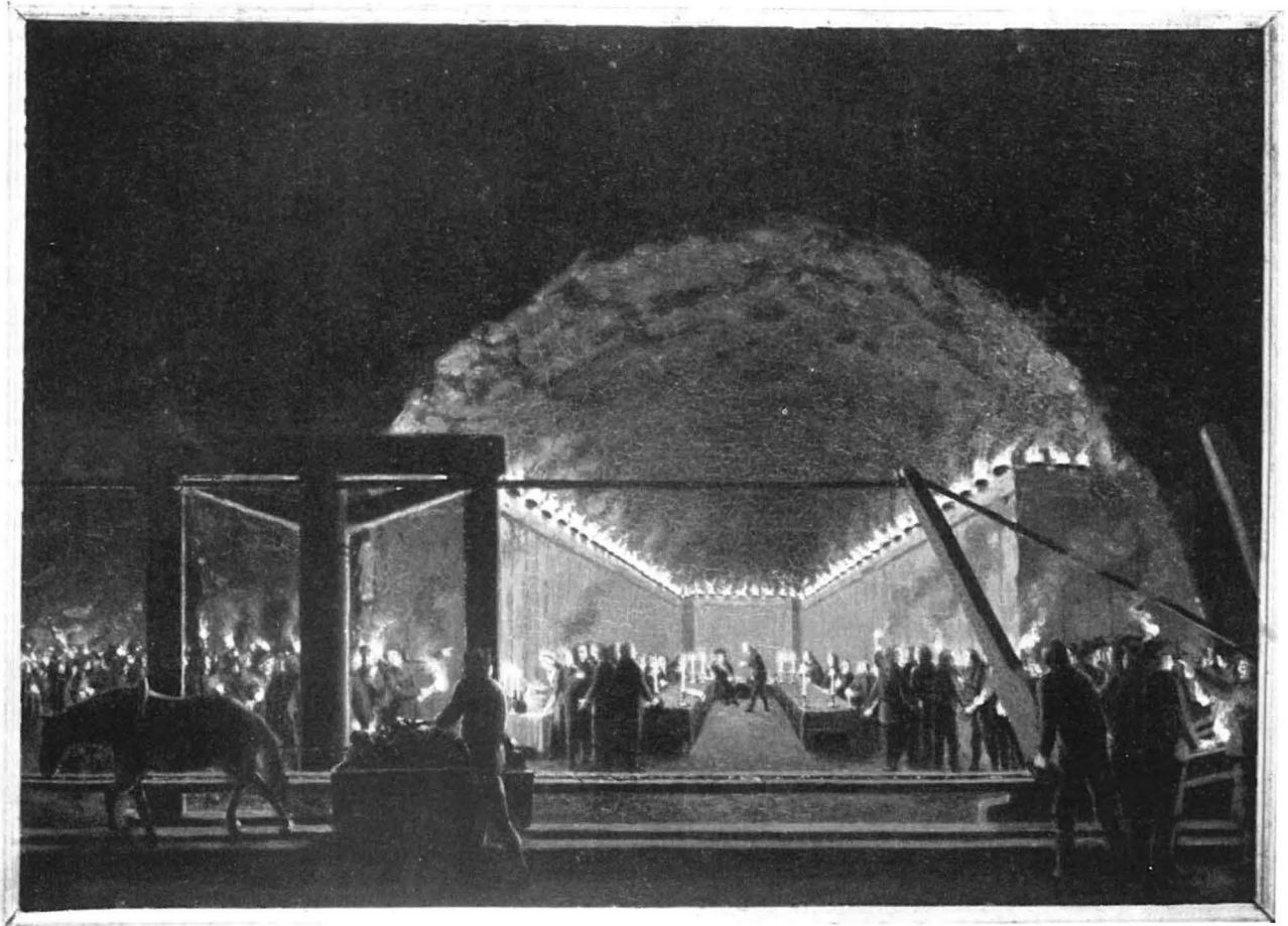
Am 20. September 1788 besuchte König Gustav III. von Schweden die Grube in Falun. Der Maler Per Hilleström, der sich im Gefolge des Königs befand, hat das festliche Ereignis in diesem Ölgemälde festgehalten.