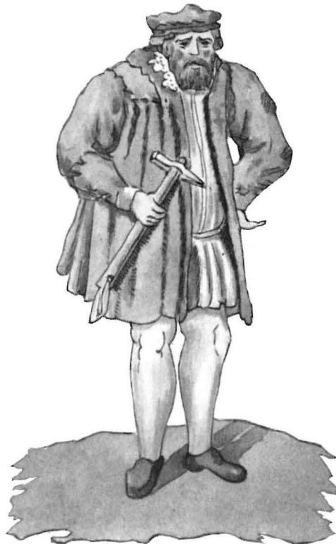
„Perckrichter“ in der Tracht der Zeit um 1550.

Der Schichtmeister hatte im besonderen zu schwören, die ihm übertragene Grubenverwaltung getreu zu führen, keine erdichteten Lohnzahlungen in die Lohnregister zu setzen und die periodisch fällige Rechnung dem Bergamt pünktlich und richtig zu legen 8 . Die Knappschaftsältesten leisteten den Eid u. a. dahin, daß sie ihr Amt gewissenhaft versehen, sich bei der Verwaltung der Knappschaftskasse, insbesondere in Einnahmen und Ausgaben uneigennützig verhalten und darüber bei Heller und Pfennig richtig abrechnen würden. Ferner hatten sie Aufwiegung und Empörung der Belegschaft rechtzeitig zu melden und ihrerseits nach Kräften zu unterdrücken 9 . Auch der Bergmann schwor, den Aufruhr bei Zeiten zu entdecken und nach bestem Vermögen zu hindern 10 . Die Geschworenen, die bei der amtlichen Beaufsichtigung der Grubenbaue mitzuwirken hatten, versprachen unter Eid, darauf zu achten, daß die Gebäude gut gehalten und die Zechen nicht „verhauen oder verstürzt“ werden 11 . Die Silberbrenner hatten zu schwören, das Silber aufs feinste zu brennen 12 . Bei den freiberuflich tätigen Probierern und Markscheidern waren die Eidesformeln u. a. auf den Kontrahierungszwang abgestellt. Diese Berufe mußten jedem, der ihrer bedurfte, zu Diensten sein. Der Eid