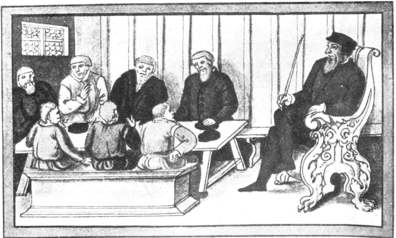
„Das Berggericht“ aus dem Schwazer Bergbuch. Der Sitte um 1550 entsprechend, sind die Personen im Größenverhältnis nicht nach den sich ergebenden Perspektiven, sondern nach ihrer Bedeutung dargestellt. Rechts im Bild der Bergrichter, hinter dem Tisch die Geschworenen, im Vordergrund Kläger und Beklagter.