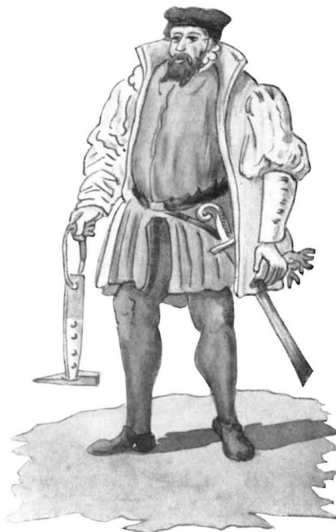
„Perckrichter“, Aquarell aus dem „Schwazer Bergbuch“.

„Zal der Fynder treten uf syne Henegebang vnd zal czwene Fynger legen uf syn Houpt, vnd zal also sprechen: Daz daz myne Funtrube sy, alz e gebrauch ich meynes Houptes vnd myner vorderen Hant, also mir Gott helfe vnd alle Heylygen“.