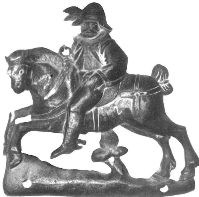
Bronzerelief eines Stülffmeisters.

hinzu, die allen möglichen bei der Einführung beteiligten Personen zustanden. Ein Verzeichnis aus dem Jahre 1760 zählt alle diese Posten in der wunderlichen Sprech- und Schreibweise jener Zeit auf. Dabei ist zu bemerken, daß es aus einem Jahrhundert stammt, in dem es mit der Glanzzeit der Saline und der Stülffmeister längst vorbei war.