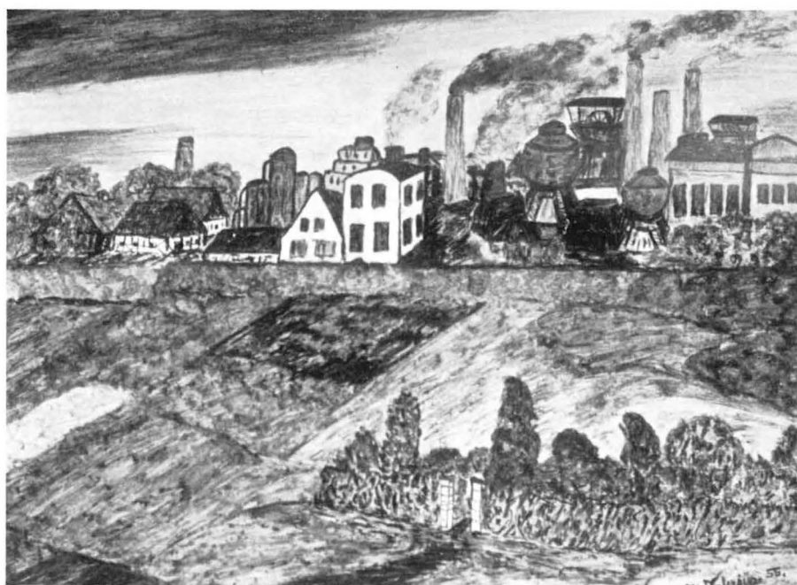
„Zechenlandschaft“ von Max Valerius, Hauer auf Zollern II.

Verkäuflichkeit ist bei Kunstwerken schon ganz und gar kein Wertmesser. Scheinerfolge von Ausstellungen und Verkäufen beeinträchtigen die Selbstkritik, ebenso wie es eine Irreführung des gutwilligen und lerneifrigen Laien-