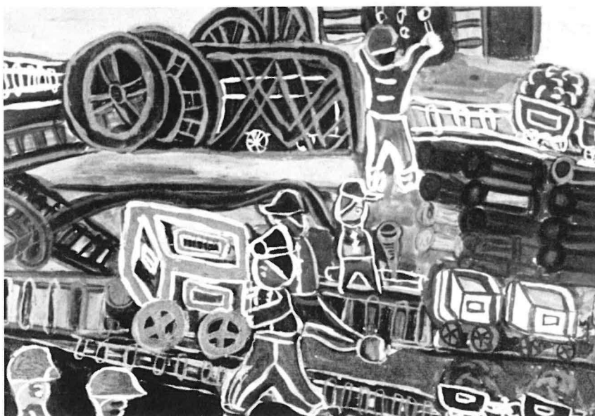
Wie ein phantastisches Abenteuer muß diesem Jungen nach den Erzählungen der Erwachsenen die Arbeit auf der Zeche erscheinen