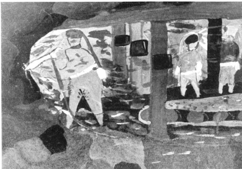
In dunkelgrünen Hemden und braunen Hosen hantieren in dieser Darstellung eines Elfjährigen die Bergleute im Schein ihrer Kopfleuchten mit dem Abbauhammer und geben die Kohle auf das auf Rollen laufende Förderband