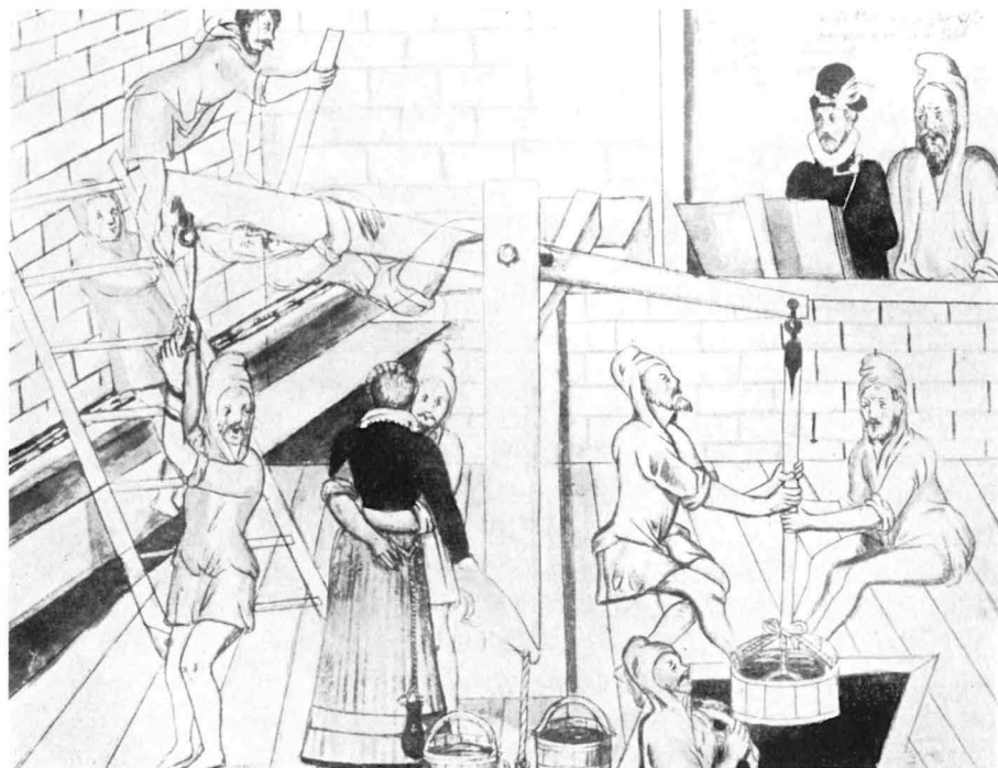
Arbeit der Sodeskumpane am Solbrunnen. Aquarell aus einer Bilderchronik um 1600. Im Hintergrund der „Stiegeschreiber“ und wohl der „Obersegger“, der Vorsteher der Sodeskumpane. Die Umarmungsszene ist unverständlich.

Wie die Stülmeister, waren auch die Sülzer in einer Gilde zusammengeschlossen, der Bruderschaft St. Hülpes, Hülperti oder Hülperrades. Die Zugehörigkeit zu dieser Gilde wurde den Sülzern durch eine Verordnung vom Jahre 1414 zur Pflicht gemacht. Die Bruderschaft besaß einen Altar und eine Vikarie in St. Lamberti, ferner hielt sie bestimmte Summen bereit, aus denen sie Almosen spendete und eine tägliche Messe sowie Totenämter bezahlte. Die Teilnahme an einem Leichenbegängnis war Ehrenpflicht und wurde