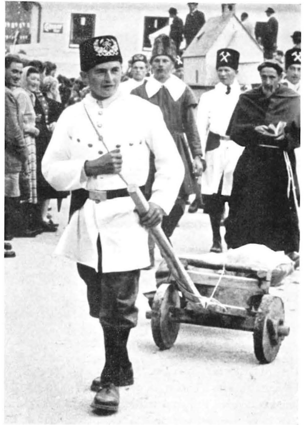
Der „Sackzug“, die einstige Erzförderung.

Diese beschauliche Ruhe wurde Mitte August für einige Tage unterbrochen, als Oberzeiring seine Tausendjahrfeier beging. Höhepunkt der Veranstaltungen war ein großer historischer Festzug mit Szenen aus der Geschichte Zeirings. Dargestellt waren u. a. Sackzieher aus der Zeit der ersten Erzförderung, die Gründung der Knappenkirche um 1111, der Aufschwung der Silbergruben unter Markgraf Otto IV. (1165 bis 1192), die Ernennung des Abtes Heinrich II. von Admont zum Obersten Bergverwalter des Landes, die Markterhebung und die Verleihung des Münzrechts, das Ende des Silberbergbaus und die vergeblichen Versuche zur Wiederaufnahme des Bergwerks, der Abbau und die Verhüttung des Eisenerzes nach 1783 sowie die letzte Blüte des Zeiringer Bergbaus von 1832 bis 1893. Ein eigens für dieses Fest geschaffenes Spiel, „Das Zeiringer Kegelspiel“, wurde mit gutem Erfolg uraufgeführt und hält so die Erinnerung wach an die bedeutungsvollste Zeit in der Geschichte des alten Silberortes Zeiring.