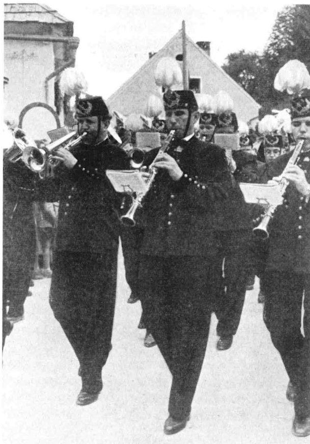
Bergkapelle im Festzug

Zur Zeit Herzog Leopolds VI. wurde in Zeiring eine eigene Münzstätte errichtet, in der die heute höchst seltenen Zeiringer Pfennige geschlagen worden sind. Bereits 1283 wurde eine Fronleichnams-Bruderschaft gegründet, aus deren Erträgnissen zugunsten armer Bergleute die sogenannten „Brudergründe“ gestiftet wurden, deren Name heute noch besteht. Erhalten geblieben sind ferner die Zeiringer Bergordnungen aus den Jahren 1336 und 1339 sowie eine Abschrift eines Zeiringer Bergrechts, die von „den ehrbaren Leuten auf der Zeiring“ den Bergleuten zu St. Leonhard im Lavanttal 1325 übermittelt worden ist. Mit der im Jahre 1339 erlassenen Bergordnung erhielt der alte Silbermarkt Zeiring Stadtrechte, obgleich er kein geschlossener, von einer Mauer umgebener Ort war.