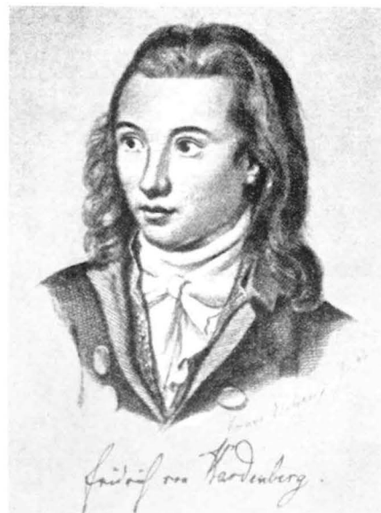
Novalis, der Dichter der Romantik (1772—1801)

Man ist oft geneigt, die Zeit der Romantik nur im Schatten der „Blauen Blume“ zu betrachten. Wenn auch nach der eisigen Gedankenkühle der Aufklärung im dichterischen Bereich eine dem Mystischen nahestehende Gefühlswoge bis an die Grenzen des Alls zu strömen trachtete, so standen dennoch feste Inseln in diesem Fließen und Sich-Treiben-Lassen. Die Wissenschaft baute Systeme auf die bloß beschreibenden Beobachtungen, denn ihre Zeit hatte längst begonnen, und man verlor sich nicht länger mehr in Spekulationen. Die Romantik der Wissenschaft liegt weiter zurück. Alchimisten und goldmachenden Scharlatanen waren kritische Denker und exakte Experimentatoren gefolgt. Die Ordnung des Chaos — bestehend aus Beobachtungen, Theoremen, Maximen und geahnten Zusammenhängen — wurde auf einem zweifachen Weg unternommen: Einmal fundierte die Mathematik die exakten Wissenschaften, und zum anderen durchflocht das Netz der Systematik die beobachtenden und beschreibenden Wissenschaften. Dem Deuten von Erscheinungen mußte naturnotwendig ein Zu- und Einordnen vorausgehen.