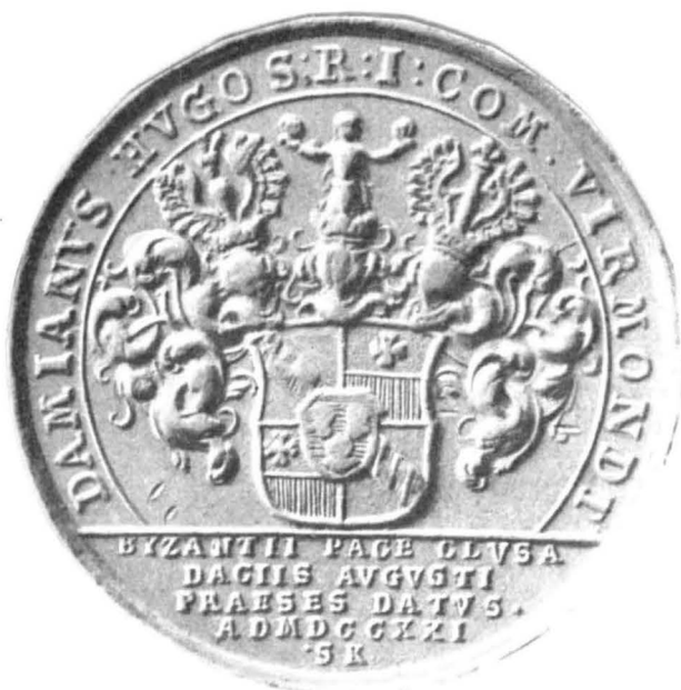
Medaille aus Siebenbürger Gold, 34,9 g schwer (10 Dukaten); Durchmesser 37 mm.