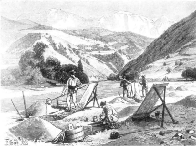
Goldwäscher im Aranyos(Goldfluß-)tale.

(Zeichnung von Th. Dörre, 1899. Aus „Die österreich.-ungar. Monarchie in Wort und Bild“.)