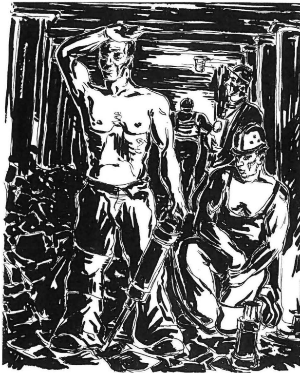
„Vor Ort“, getuschte Federzeichnung von Karl Kunert, Zeche Rheinpreussen.