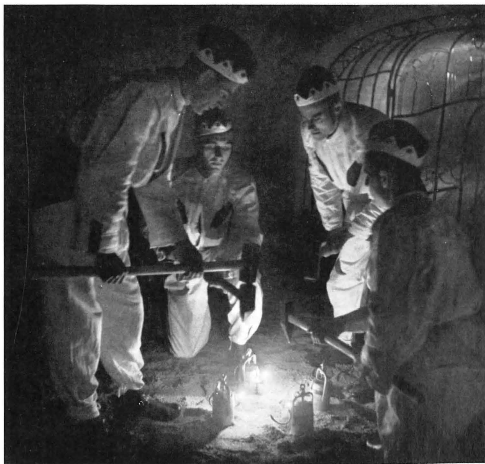
Über den niedergestellten Geleuchten schlagen die Knappen zur Begleitung der Musik auf die untergesetzten Eisen mit ihren als Klangkörper gestimmten Schlägeln.