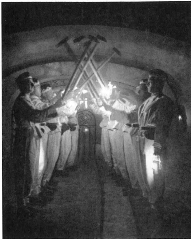
Die Knappen stehen sich in zwei Gliedern gegenüber und verbinden sich mit ihren Schlägeln zu einer symbolischen Darstellung eines Stollens.

Bläserquintett dargebrachten bekannten Bergmannsweisen (Ja den Söhnen da droben unterm Berge; Glück auf der Steiger kommt; Ich bin ein Bergmann, kennt ihr wohl das Zeichen; Schon wieder tönts vom Schachte her; Der Bergmann im schwarzen Gewande) zu ebenso vielen Bildern, dem „Stollen“, dem „Schurf“, dem „Schacht“, der „Häuerarbeit“ und letzten Endes der „Einbringung der Barbara“, zusammen.