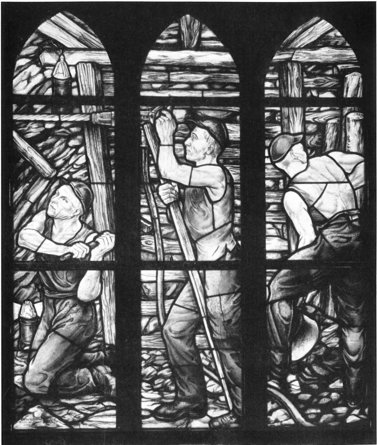
Fenster der Harpener Kirche mit bergmännischen Motiven.

wie irgendein Nebengottesdienst gehalten werden; er darf auch nicht mit einem Hauptgottesdienst gekoppelt sein. Es müssen Besprechungen stattfinden mit den Zechenleitungen, den Direktoren, der Betriebsleitung, dem Betriebsrat, der Gewerkschaft, den Knappenvereinen und Gesangsvereinen. Der Organist, der Posaunenchor (wo bergmännische Bläserchöre fehlen) und Vertreter der Heime