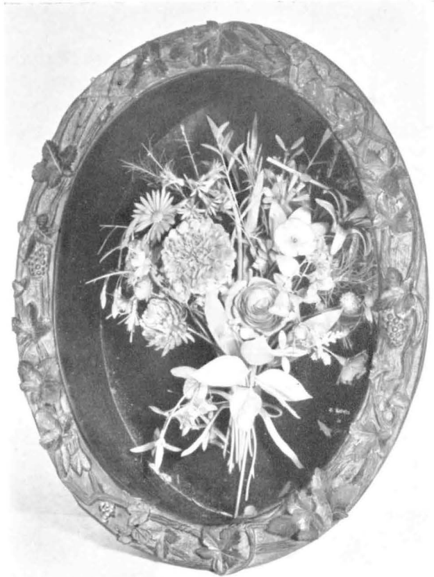
Blumenstrauß; Holzschnitzarbeit von Kaltofen.

Seine bergmännische Welt darzustellen, war nach seinen eigenen Worten Kaltofens liebste Beschäftigung. Wohl alle bergmännischen Arbeiten über Tage und unter Tage hat er in seinen zahlreichen Figuren und Reliefs künstlerisch ge-