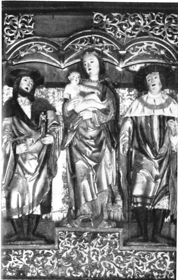
Mittelteil des Flügelaltars vom Kiechelberg aus dem Jahre 1525. Links Daniel als Bergmannsheiliger.

mark). Die verschiedenen Funktionen, die für die beiden Heiligen in der bergmännischen Glaubenswelt Gültigkeit hatten, kommen in variierten Anrufen auf der Eisenerzer Fahne zum Ausdruck: „Heiliger Daniel, bitte für uns!“ und „Heilige Barbara, beschütze uns!“. Die beiden Sakralgestalten der Bergleute treten auch andernorts noch gemeinsam auf, jedoch nicht im gleichrangigen Verhältnis. In der Kiechelberger Kapelle und in Kitzbühel ist Daniel nach Größe und Anordnung dominant, in Gossensaß dagegen St. Barbara.