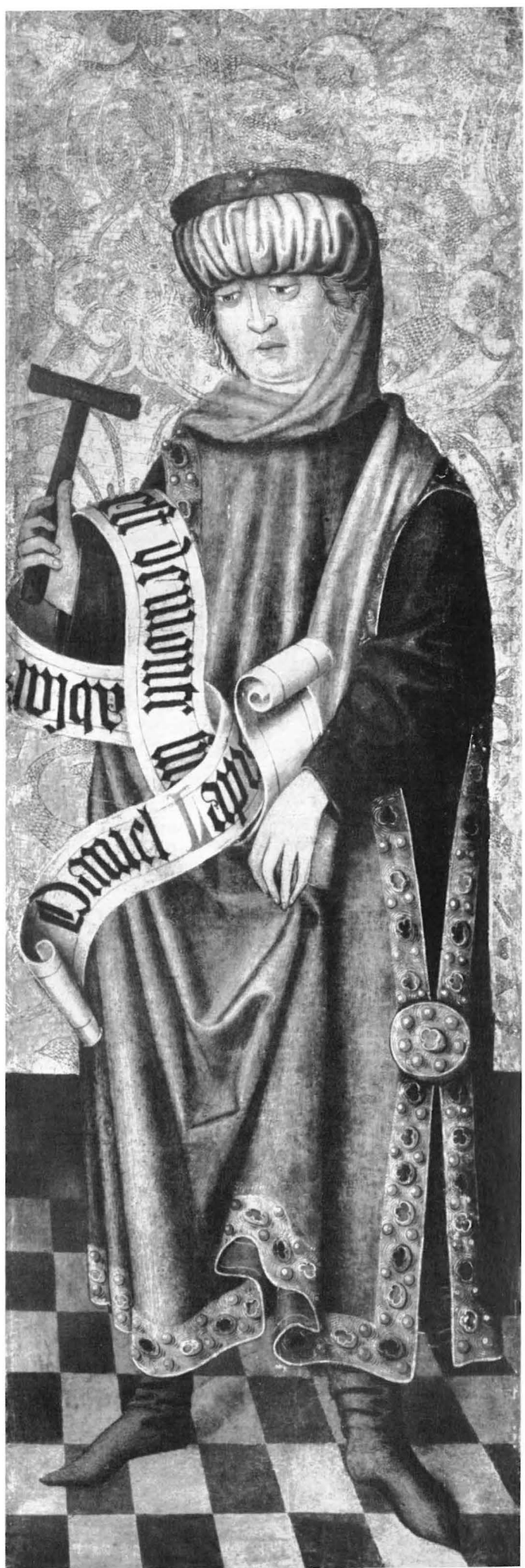
Danielfigur des Meisters der Halleiner Epiphanie aus dem zweiten Drittel des 15. Jahrhunderts. Vor einem Goldhintergrund mit reichem Stichelornament steht die gedrungene Gestalt des Heiligen mit Schlägel und Schriftband, das einen Hinweis auf den alttestamentarischen Daniel enthält. Das Originalgemälde (33 : 103 cm) befindet sich im Bergbaumuseum Bochum.