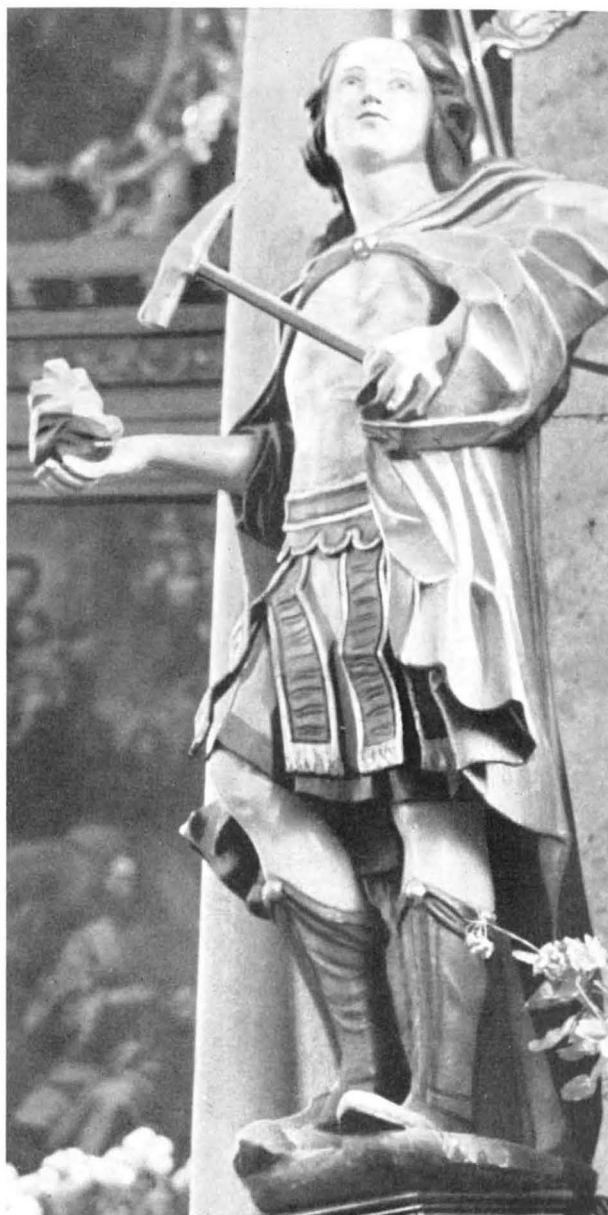
St. Daniel in der Pfarrkirche zu Kitzbühel

Es gibt eine ganze Anzahl ikonographischer Zeugnisse von dieser Traum- und Fundgeschichte, die hier zum erstenmal in dieser Vollständigkeit zusammengestellt sind. Das bekannteste findet sich auf dem oft als Quelle für die Bergbauverhältnisse am Ende des Mittelalters angeführten Bild des Knappschaftsaltars zu Annaberg (Erzgebirge) von 1521, wo sie in drei Szenen behandelt ist: 1. der Engel führt Daniel zum Baum; der Prophet ist als bärtiger Mann dargestellt, der in einen langen roten Mantel und eine runde dunkle Kappe, beide pelzverbrämt, gekleidet und durch eine über der rechten Schulter getragene Barte als bergbauzugehörig signiert ist; 2. Daniel ist auf den Baum geklettert, und der heranschwebende Engel verweist ihn nach unten; die realistische Darstellung hat nicht die an den Baum gelehnte Leiter vergessen, ebensowenig wie den am Fuß des Baumes abgelegten großen Mantel und die in den Stamm eingehauene Barte, die beide am Steigen gehindert hätten; 3. ein Bergknappe beginnt mit geschwungener Keilhaue am Fuß des Baumes zu schürfen. Von dieser Legendarisierung, die sich im linken oberen Viertel des Bildes befindet, her, also von dort aus, wo der Maler seine Arbeit begonnen hat, breitet sich das Bergrevier mit der reichen Differenziertheit