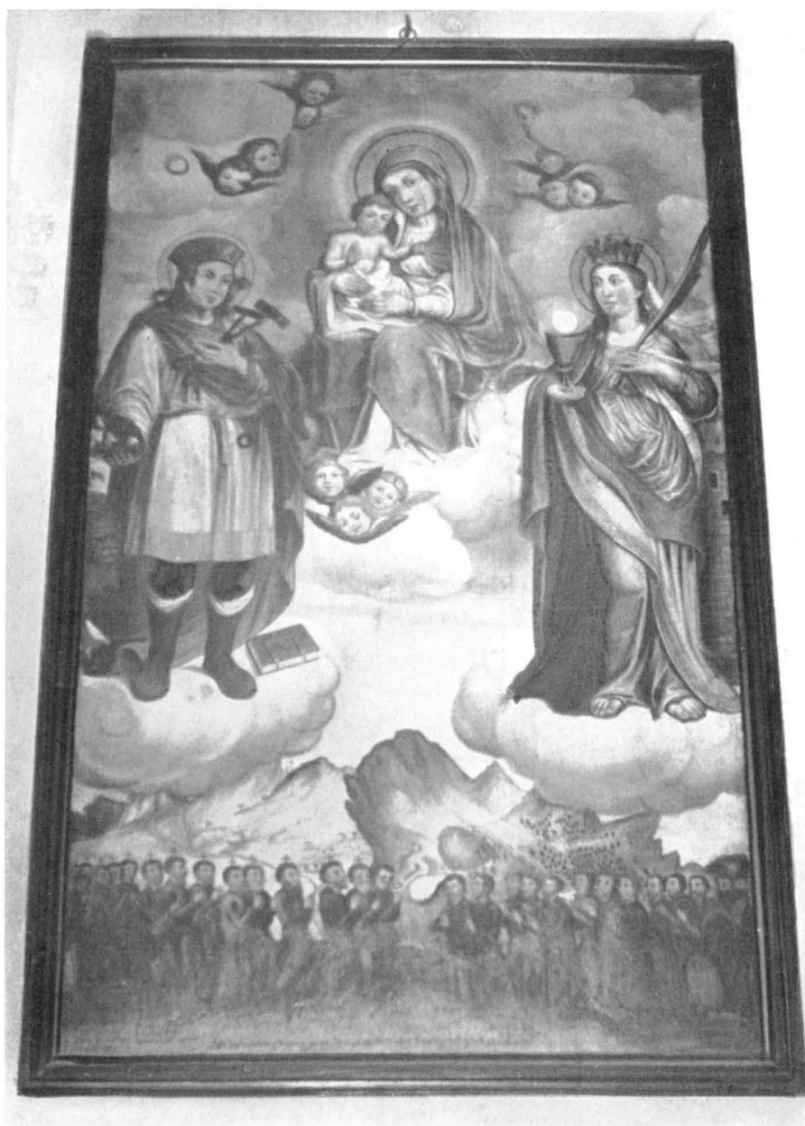
Gedenktafel von 1693 in Moos (Südtirol) mit Daniel und Barbara als Schutzpatronen der Bergleute

Das Schutzpatronat im engeren Sinn fällt aber im allgemeinen St. Barbara zu, deren Verehrung an zahlreichen Stellen mit der des Propheten verbunden worden ist. Als frühes eindrucksvolles Zeugnis für dieses Miteinander besitzen wir das schöne Glasgemälde von Villanders (Südtirol) aus der Zeit um 1500, wo die beiden mit ihren typischen Kennzeichen die Madonna flankieren. Auf einer Knappenfahne am gleichen Ort und auf dem Altar der benachbarten Kapelle St. Anna in Rotlan ist diese gemeinsame Verehrung bis ins 18. Jahrhundert belegt. In derselben Anordnung, links und rechts der Madonna, treten Daniel und Barbara gleichrangig noch einige Male im Alpenraum auf, so auf dem Votivbild in Moos und auf dem Altar der Bergmannskapelle am Schneeberg im Passeier. Partner sind sie auch auf einzelnen alpenländischen Bergwerksfahnen, z. B. in Brixlegg (Tirol), in Schladming und in Eisenerz (Steier-