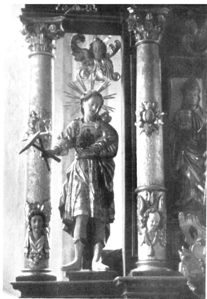
Der Bergmannsheilige in der Kirche von Dienten (Salzburg)

Bergmannsheiligen alle Danielsattribute beigegeben sind, die wir kennen: Schlägel und Eisen, Erzstufe, Löwe und Buch (mit Ausnahme nur der erzgebirgischen Bergmannsbarte).