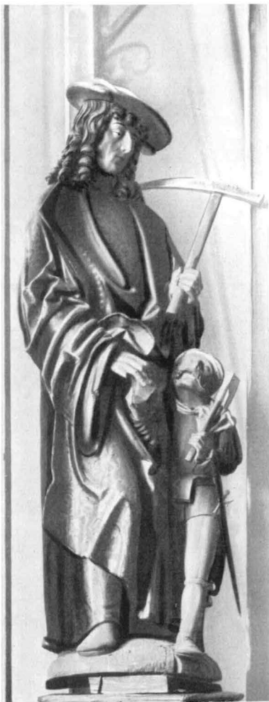
St. Daniel mit Bergknappen am Aufsatz des Bergaltars in der St.-Annen-Kirche zu Annaberger (Erzgebirge) und Relief mit der Daniel-Legende auf dem Annaberger Schlußstein des Meisters Hans Witten (um 1520)

Trotz dieser Hoheit im Erscheinungsbild, die durch den meist beigegebenen Heiligenschein noch verstärkt wird, bleibt er den Bergleuten durch seine Funktion nahe, und diese Zuordnung tritt durch seine Insignien augenfällig zutage. Die vorherrschenden Attribute sind Schlägel und Eisen, entweder einzeln oder gedoppelt, und Erzstufen von verschiedener Art und Größe, die er im Sinn seiner Aufgabe als Entdecker von Bodenschätzen oft in einer begutachtenden Gebärde hält oder entgegennimmt. Auf dem Annaberger Bergbaubild trägt er als Berufszeichen die Bergbarte, die als Mittelding zwischen Waffe und Werkzeug, zwischen Streitaxt und Grubenbeil ein für das Erzgebirge charakteristisches Element des bergmännischen Habitus ist. Nur in einzelnen Fällen geht die Integrierung in die Arbeitswelt der