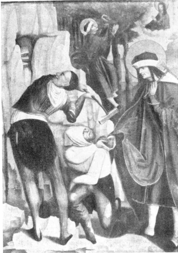
Daniel-Legende auf einem Gemälde in der Schloßkapelle Blühnbach bei Werfen. Für die Reproduktion stellte der Verlag Rohrer, Baden b. Wien, freundlicherweise das Klischee der Tafel 432 aus Band 28 der Österreichischen Kunsttopographie zur Verfügung.

Die Baumszene allein ist auf dem St.-Wolfgang-Altar von Buchholz (Erzgebirge, um 1515) wiedergegeben. Hier ist der Suchende in zünftiger Bergmannstracht, aber der Strahlenkranz um sein Haupt läßt keinen Zweifel, daß es sich um Daniel handelt.