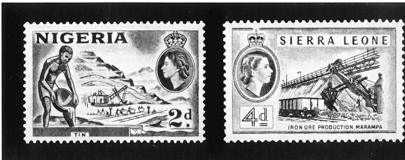
Zinnerz-Tagebau und eingeborener Bergmann mit Waschschüssel (Ni 2); rechts Gewinnung von Eisenerz im Tagebau Marampa (SL 1).

Die Phosphatgewinnung begann schon 1921, entfaltete sich jedoch erst nach Beendigung der Kampfhandlungen gegen Abd-el-Krim, den Emir von Melil, der von 1921 bis 1924 einen Krieg zur Befreiung Marokkos aus französischer und spanischer Herrschaft führte. Seit 1924 stieg die Phosphatförderung schnell an und beträgt jetzt fast 4 Millionen t jährlich. Die Gewinnung und der Verkauf der Phosphate wird von der Direktion der staatlichen Phosphatgruben (l'Office chérifien des phosphates) geleitet, die im Jahre 1922 gegründet wurde. Zum 25jährigen Jubiläum der Phosphatgewinnung durch den marokkanischen Staat hat die Postverwaltung von Marokko 1947 eine Briefmarke herausgegeben (M 1), auf der ein Teil der marokkanischen