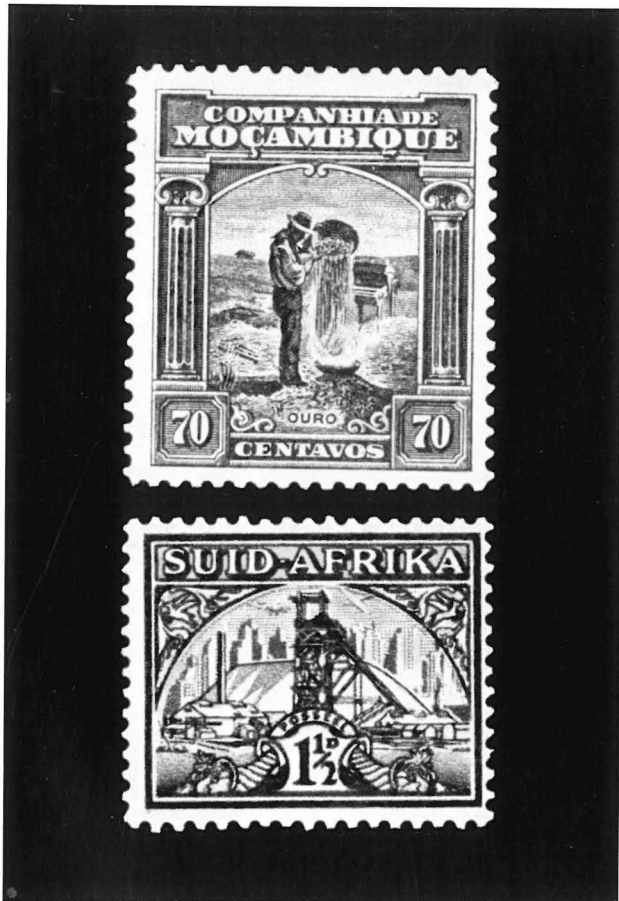
Goldgräber mit Waschschüssel (Mo 1) und Schachtanlage in Witwatersrand (SA 2).

küste, der jetzige selbständige Staat Ghana, ein (1957: 310 000 t). Deshalb trägt ein Wertzeichen von 1948 die Ansicht der Manganerzgrube bei Nsuta (Go 1). Es ist der größte Manganerz-Tagebau der Welt, in dem das Erz mit hochleistungsfähigen Löffelbaggern gewonnen wird. Dasselbe Bildmotiv ist für eine Briefmarke der Ausgabe 1953 verwendet worden (Go,2), die im Jahre 1957 zur Unabhängigkeitserklärung der Republik Ghana mit einem entsprechenden Aufdruck versehen wurde (G 1).