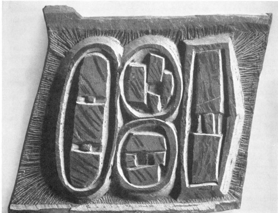
Tisch mit Broten. Schieferrelief 1957.

Novarina eine für die Gäste bestimmte Brunnenhalle gebaut worden, in der eine ganze Schiefermauer (Größe 2,15 m × 6,50 m) Ubacs errichtet wurde. Darüber schreibt der Augenzeuge A. Schulze-Vellinghausen: „Die Kurkapelle thront nicht auf einem Podium vor goldener Muschel, sondern spielt mitten im Raum — vor einem dunklen, etwas mehr als mannshohen Paravent. Quergestellt, unterteilt er die relativ schmale Halle (etwa im „goldenen Schnitt“), ohne ihren Fluß zu unterbrechen. Von diesem Paravent strömt — schon auf größeren Abstand hin —