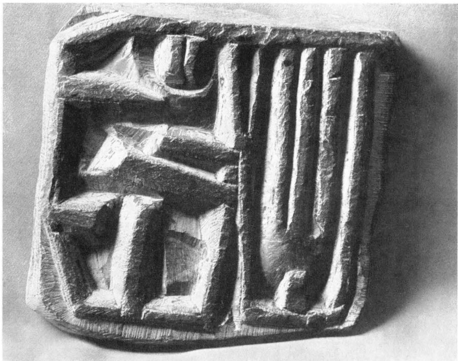
Kopf und Hand. Schieferrelief 1956.