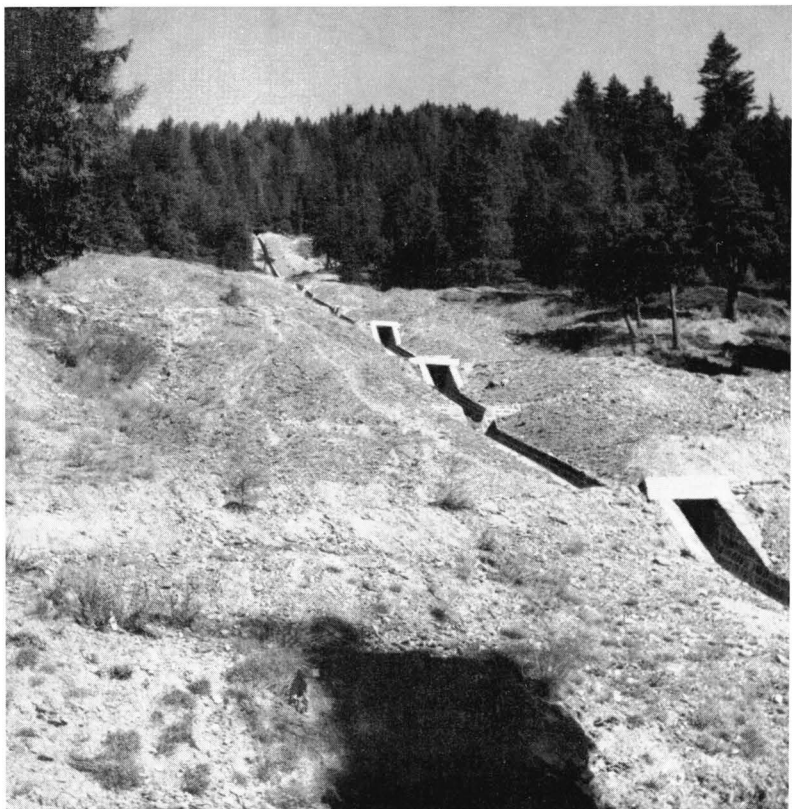
Abb. 2: Urzeitliches Waschhaldengelände Vetriolo Vecchio. Ansicht von Süden.

Der Einschnitt, dessen Länge mit Rücksicht auf das Künettensystem auf acht Meter begrenzt bleiben mußte, erreichte bei einer durchschnittlichen Tiefe von 1,80 Metern den alten Boden, ohne daß auch nur die Spur einer Kulturschicht zu erhalten gewesen wäre. Die in den Haldenbergen verstreuten Funde waren ebenso spärlich wie unbedeutend; im wesentlichen beschränkten sie sich auf Bruchstücke von Zerkleinerungssteinen, wie solche jedoch auch an der Oberfläche reichlich zu sehen sind. Das Profil des Einschnittes zeigte die gewohnte Wechsellagerung von Handscheidebergen und Feinkornabgängen.