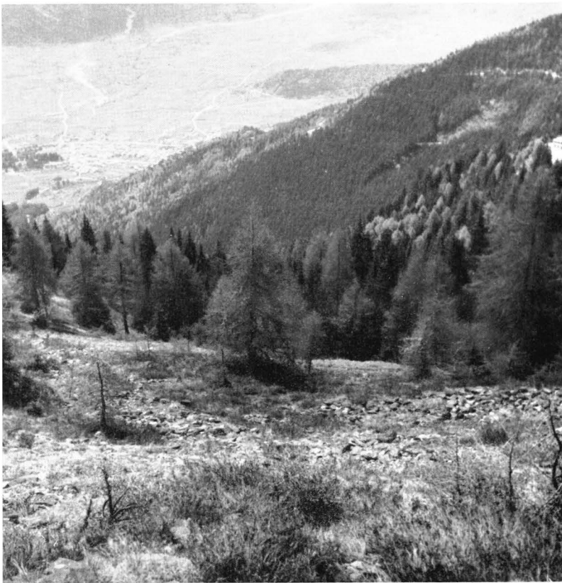
Abb. 1: Urzeitliches Bergbaugelände Vetriolo, westlicher Teil. Ansicht von Norden. Im Hintergrund die Stadt Levico.