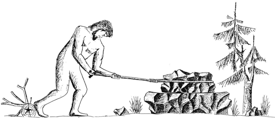
Abb. 6: Rekonstruktion der bronzezeitlichen Feinzerkleinerung. Entwurf: E. Preuschen, Zeichnung: N. Lidauer.

Für das Studium der urzeitlichen Zerkleinerungstechnik wird man in Zukunft nach Trento kommen müssen. Die aus dem idealen Werkstoff Porphyry gefertigten Typen von Vetricolo zeigen alle Einzelheiten viel deutlicher als die aus dem dürftigen Granitgneis der Nordalpen erzeugten. Durch diese reichen Belege eröffnet sich der einschlägigen Forschung eine ganz neue Epoche. Ein systematisches Studium der nur