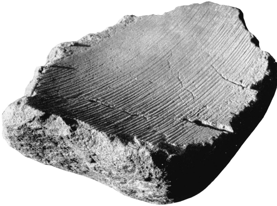
Abb. 4: Großer Bodenstein von Vetriolo. Grundrißmaße 57 zu 35 cm, Stärke 18 cm.

war bei einer Korngröße der Erzteilchen bis herunter zu etwa 5 mm wohl noch möglich. Der größte Teil des Vetrioler Hauwerkes hatte aber zweifellos wesentlich feinere Verwachsung aufzuweisen, so daß sich sowohl eine Handzerkleinerung als auch ein händisches Auslesen der Erzteilchen als unwirtschaftlich verbieten mußte. So ergab sich die Notwendigkeit einer mechanischen Feinzerkleinerung und einer mechanischen Feinaufbereitung.