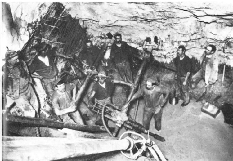
Long-Tunnel-Mine, 4000 Fuß unter Tage.