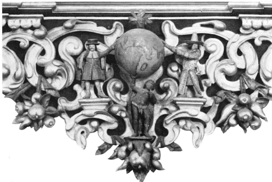
Der untere Teil des Hartzing-Epitaphs mit der Weltkugel.

v. Resandt: De gezaghebbers der Oost.-Ind. Companie.