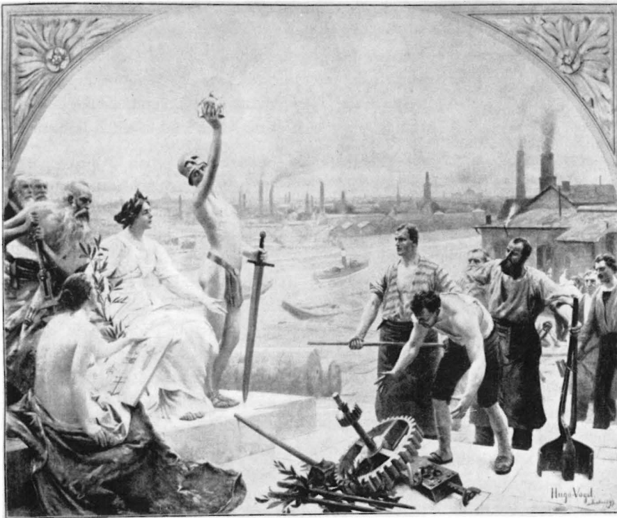
„Die Arbeit huldigt der Industrie“, Gemälde von H. Vogel. Aus: H. Kraemer, Das XIX. Jahrhundert in Wort und Bild , III. Band, Berlin o. J.

durfte 12 . Sein Interesse für technische Probleme, sein waches Auge für die technischen Installationen, seine Begeisterungsfähigkeit für technische Erfindungen und sein Raisonement über deren Bedeutung für den menschlichen „Fortschritt“ — all dies hat sich mehr oder minder stark auch in seinen Gedichten niedergeschlagen.