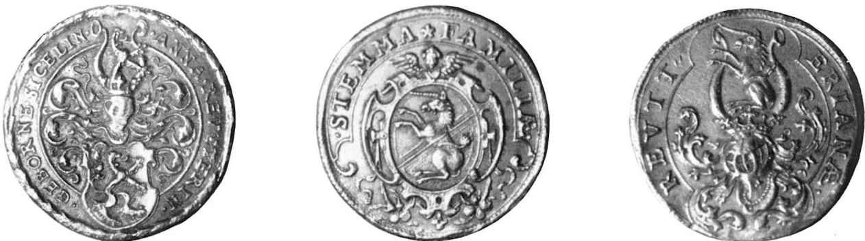
Vorder- und Rückseiten der in den Fuß des Kelches eingelassenen Reutter-Medaillen.