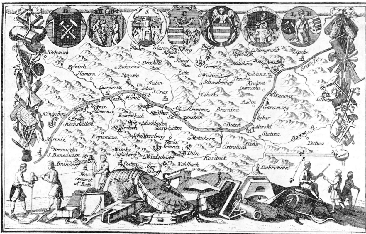
Das niederungarische Bergbauggebiet in einer Zeichnung von Andreas Organist aus dem Jahre 1573. Am oberen Rand die Wappen der sieben freien Bergstädte Dilln, Königsberg, Schemnitz, Kremnitz, Neusohl, Bugganz und Libeten. Aus: „Neue Bergordnung des Königreichs Ungarn . . .“, Wien 1760.

Fluche anbefahl, diese Weisung auch wirklich auszuführen und dann die Asche den Winden zu überantworten 2 !