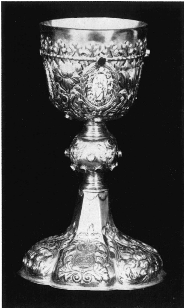
Vergoldeter Abendmahlskelch mit den Insignien der Schemnitzer Waldbürger-Familie Reutter aus dem Jahre 1714.

Schlußteil endigt auf der einen Seite in einem flachen Rücken, auf der anderen bildet er eine kleine zugespitzte Pyramide. Der etwas gebogene Stiel ist in bezug auf seine technische Gestaltung und seinen Schmuck mit dem Schlägel völlig identisch.