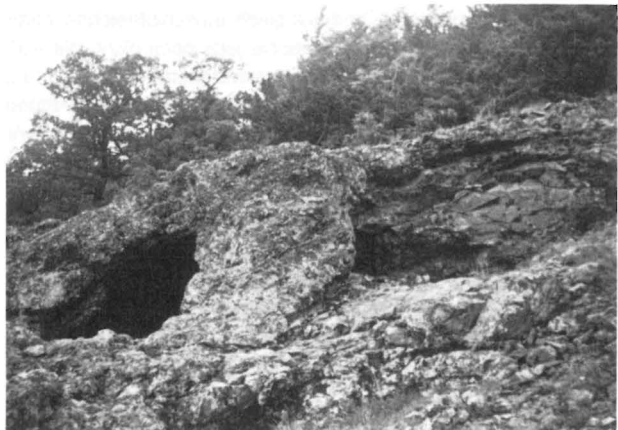
Mali Šturac. Zerstörter Eingang in einen alten Abbau