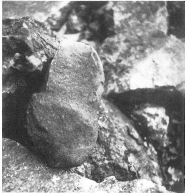
Mali Šturac. Rillenschlägel in situ, Oberflächenfund

Auch in Serbien und Bosnien wurden Reste prähistorischer Bergbautätigkeit entdeckt. Erwähnt seien hier Jarmovac, Bor und Mračaj. Bis auf Mračaj, wo im Laufe der Spätbronzezeit sulfidische Kupfererze abgebaut wurden, fehlen für diese Anlagen jedoch genauere Datierungshinweise (vgl. Jovanović, B.: Rudna Glava, najstarije rudarstvo bakra na Centralnom Balkanu, Beograd 1982).