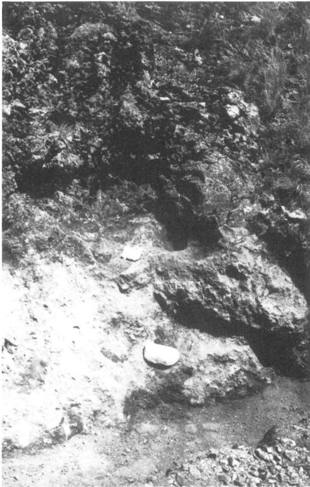
Mali Šturac. Schacht 2 mit einem auf Niveau 1 gefundenen Geröllschlüssel

Zur Datierung der ausgearzten Gänge können gefundene Rillenschlüssel herangezogen werden, zwei größere Fragmente und zwei guterhaltene Schlüssel sind in Schacht 1 in einer Tiefe von 0,30 bzw. 0,67 m gefunden worden, ein massiver Schlüssel konnte aus Schacht 2 geborgen werden. Ähnlich wie in Rudna Glava befanden sie sich an der Eingangsöffnung der Grubenbaue. Die Schicht aus Geröll und Humusablagerungen in beiden Schächten von Mali Šturac endete bereits in einer Tiefe von 0,30–0,40 m. Darunter folgte eine Schicht dunklen Bodens, der stark mit Hauklein und Erzstücken durchsetzt war. Wahrscheinlich wurden beide Schächte noch während der gesamten Betriebszeit des Bergwerks zugeschüttet, und zwar mit Material, das beim Abteufen weiterer Schächte anfiel.