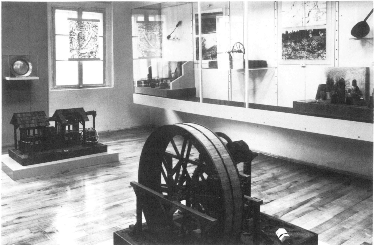
Sammlungsabteilung des Zinnbergbau-Museums in Krupka

Eingegangen wird auch auf die Zeit des vorübergehenden Niedergangs der Förderung in den böhmischen Zinnerzlagern als Folge der Einfuhr billigen malaysischen Zinns in der zweiten Hälfte des 19. Jh. In den meisten Grubenrevieren orientierte man sich auf eine Ersatzproduktion, die man vor allem in der Spitzenklöppelei, der Strumpf- und Handschuhherstellung, der Knopfmacherei sowie der Zündholz- und Spielwarenherstellung suchte, namentlich aber auch im Glashüttenwesen und in der Porzellanindustrie. Zu all diesen Produkten enthält das Museum eine reiche Dokumentation.